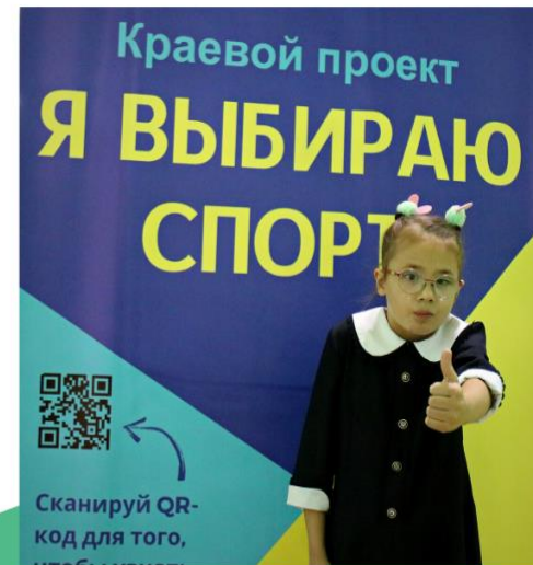
«Спортивная адаптивная зима»