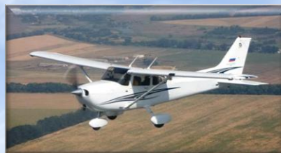
Cessna-172 8 ВС