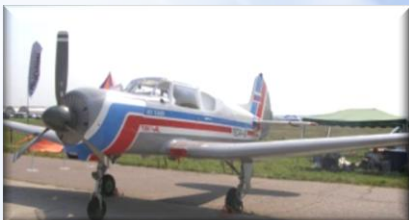
Як-18Т 36 серия