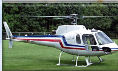
Еврокоптер-350 2 ВС