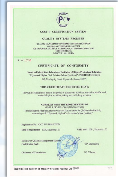
Сертификат соответствия ГОСТ Р ИСО 9001-2001 (ИСО 9001-2000) №10743 25 от декабря 2008 года