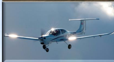
Da-40NG 16ВС (Tundra)