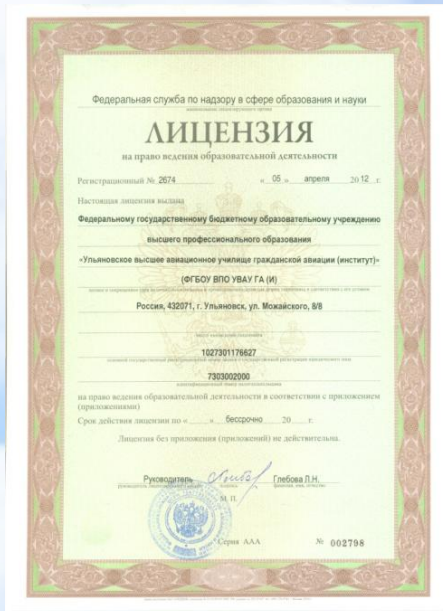
Лицензия Федеральной службы по надзору в сфере образования и науки № 2674 от 05 апреля 2012 года