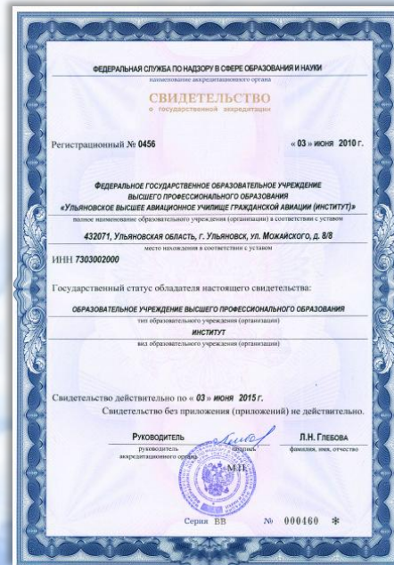
Свидетельство о государственной аккредитации Федеральной службы по надзору в сфере образования и науки № 0456 от 3 июня 2010 года