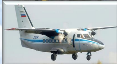
L-410 3 ВС